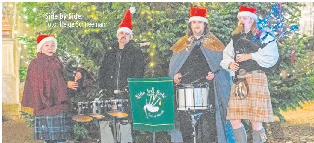
Side by Side.