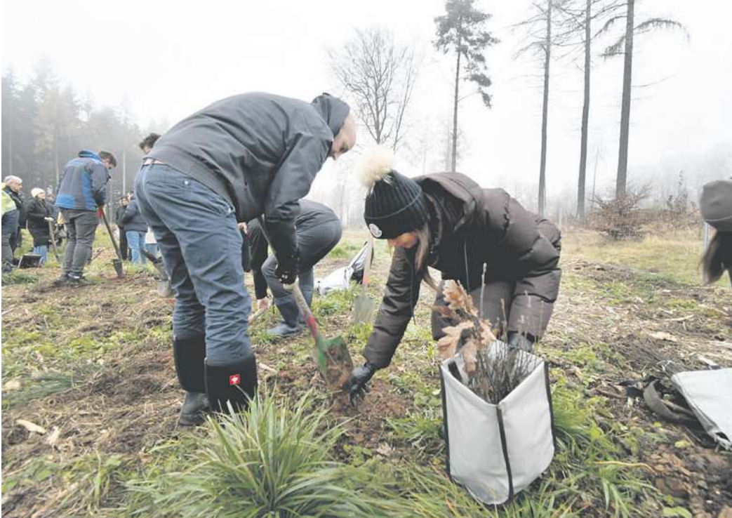
Da die Wurzeln der kleinen Eichen nur möglichst kurz an der Luft sein sollen, werden die Baumpaten mit entsprechenden Transporttaschen ausgerüstet.