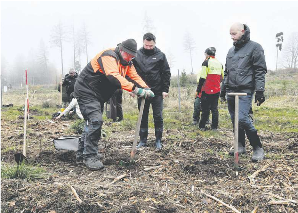
Weil der Boden im Leinholz besonders steinig ist, wird mit Hohlspaten im sogenannten Harzer Pflanzverfahren gearbeitet – hier wird das Team vom Autohaus Glinicke eingewiesen.