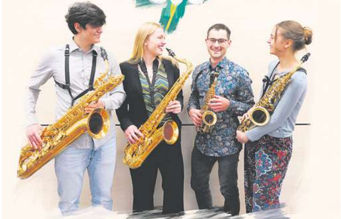
Über 120 Kulturschaffende treten bei der 23. „KUNST-Gala“ in Göttingen auf, hier: Sus4.

Besucherinnen und Besucher können sich auf eine bunte Mischung von Künstlern di-