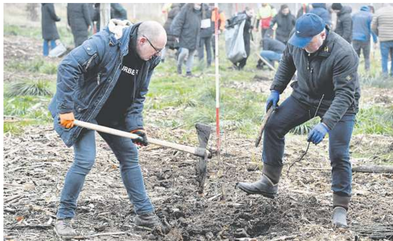
Voller Einsatz vom Team Künemund aus Gieboldehausen.

Große BAUMPFLANZAKTION mit Baumpaten im Leinholz