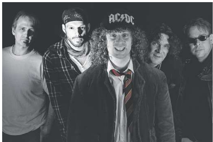
Der Verein Nuts4Rock bringt 2026 die Tribute-Bands FA/KE (Foto, AC/DC) und Powerslave (Iron Maiden) in die Region. Am 6. Juni ist großes Open Air mit Bonfire und Firewind. Foto: FA/KE