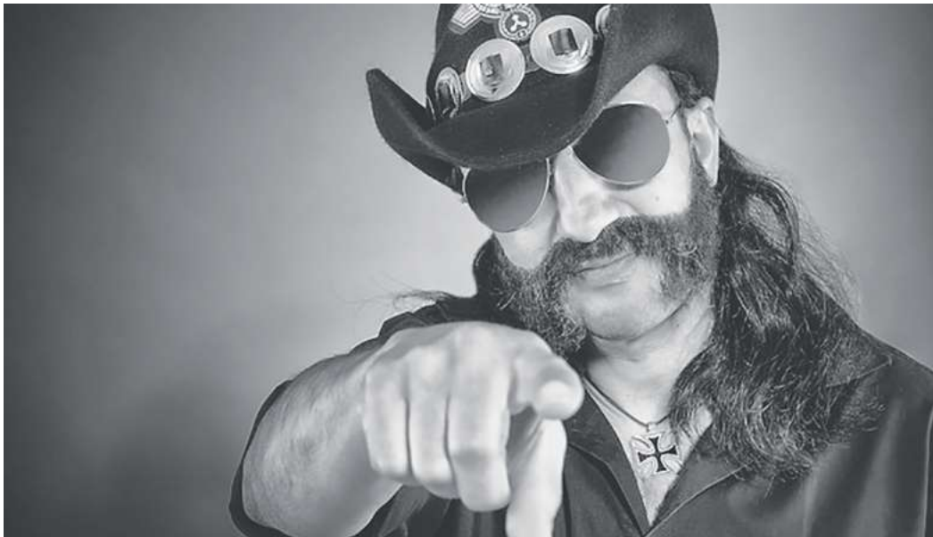
Mit „Stille Nacht“ ist es spätestens am 27. Dezember vorbei, wenn Motörhead CZ Revival im Exil die Musik von Lemmy Kilmister & Co. zelebrieren.

Kino Lumière: 15.00 Pumuckl und das große Missverständnis, 20.00 Springsteen - Deliver Me From Nowhere Méliès: 17.30 und 20.00 Der Held vom Bahnhof Friedrichstraße Live-Musik/Party 20.00 Exil: Motörhead CZ Revival, Support Audiokill