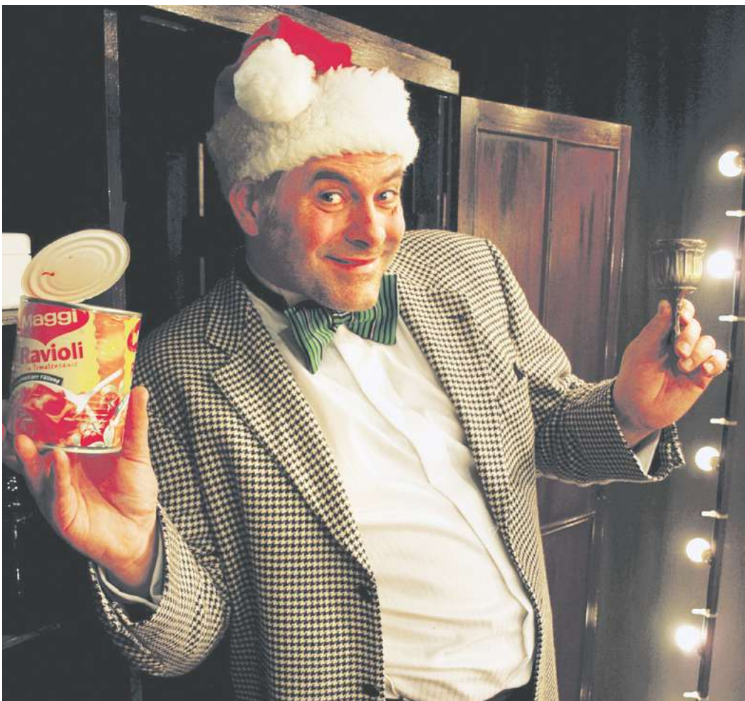
Die Theatergruppe Stille Hunde zeigt ihre Version von „Eine Weihnachtsgeschichte“ am 20. und 21. Dezember im Apex.

Sonstiges/Ausflug 11.00 ab Gästeinfo Duderstadt: klassischer Stadtrundgang, 14.30 Auf ein Stündchen mit dem Scharfrichter (Stadtführungen) 11.00 Stadtbibliothek Göttingen: Vorlesen für Kinder 11.00 Forum Wissen: Rundgang im Rahmen der Sonderausstellung „Magisch!“, 15.00 Rundgang durch die Basisausstellung 11.30 ab Tourist Info Göttingen: Rund ums Gänseleisel, 14.00 und 16.00 Geheimnisse alter Gewölbekeller (Stadtführungen) ADVENT 10.00-12.00 und 16.00-18.00 Klosterkirche Nikolausberg: Krippenausstellung geöffnet 15.00 St. Servatius Duderstadt: Musik zum Zuhören und Mit-