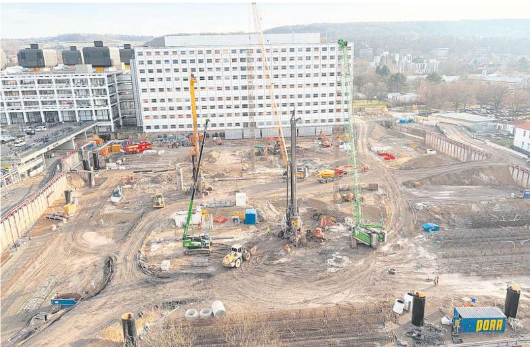
Gut in der Zeit: Rund 330 der insgesamt 657 Stahlbetonpfähle sind bereits auf dem Neubaufeld der Universitätsmedizin Göttingen gesetzt.

GÖTTINGEN. Das Alte Rathaus in Göttingen bleibt den kompletten Januar 2026 geschlossen. Grund ist der gescheckte Nagelkäfer, landläufig Holzwurm genannt, der im Gebälk der Großen Halle gefunden wurde. Zur Beseitigung des Schädlings wird Gas eingesetzt – im kompletten Gebäude.