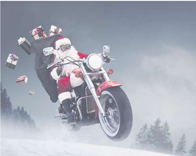
Jetzt aber schnell noch mitmachen! Es warten unter anderem ein 100-Euro-Einkaufsgutschein für den Kauf Park und ein Strandkorb auf Gewinner!