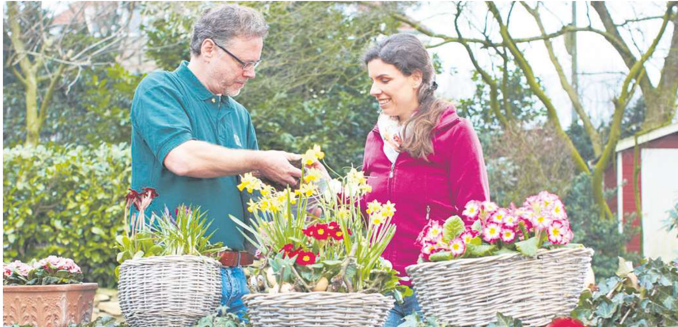
Narzissen und Primeln sorgen in Körben für leuchtende Farben im Garten.

Zu den bewährten Vertretern zählen Hornveilchen, Ranunkeln, Blaukissen, Narzissen und Primeln. Sie vereinen Farb-