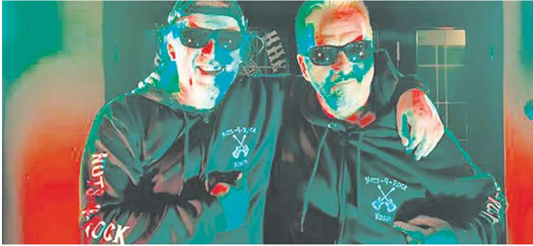
Der Verein Nuts4Rock feiert am 28. März sein 25-jähriges Bestehen mit einer großen Party im DGH Hevensen, die Ghost Brothers spielen dazu Acoustic Classic Rock.

11.00 Brotmuseum Ebergötzen: Backaktion Gebildebrote früher und heute 11.30 ab Tourist Info Göttingen: Rund ums Gänseliesel, 13.30 Göttinger Geschichten von Genie und Irrtum (Stadtführungen) 11.30 Stadtbibliothek Göttingen: Vorlesen für Kinder 13.00, 16.30 und 20.00 Lokhalle: Holiday on Ice, „Cinema of Dreams“ ab 14.00 Nordcampus: Astronomietag, Programm bei www.mps.mpg.de