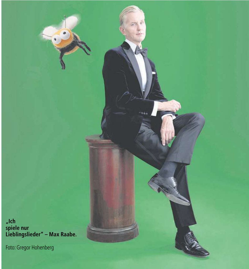
„Ich spiele nur Lieblingslieder“ – Max Raabe.

Das war im Studium, einige Kommilitonen haben sich auch mit Jazz und Klassik beschäftigt. Auf dem Flohmarkt haben wir irgendwann jede Menge originales Orchester-Material mit Stücken aus den 20er- und 30er-Jahren gefunden. Wir hatten die Idee, damit ein Tanzorchester zu gründen und unter anderem auf Studentenbällen zu spielen, um uns etwas dazuzuverdienen. Das hat ganz gut funktioniert, und wir sind dabei geblieben.