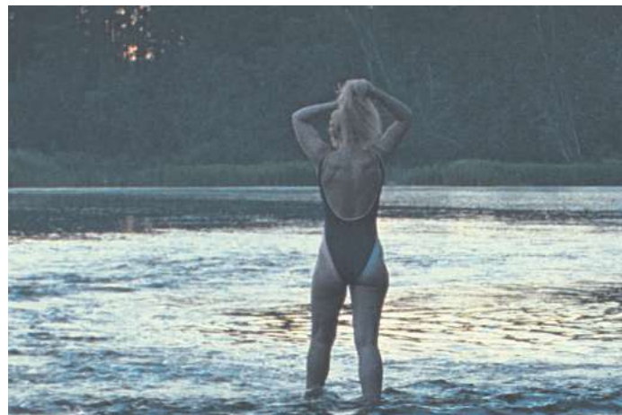
Das Lumière zeigt am Sonntag und Montag „The Chronology of Water“. In ihrem Regiedebüt widmet sich Kristen Stewart der Autobiografie der Schriftstellerin und Schwimmerin Lidia Yuknavitch.

Lumière: 20.00 The Testament of Ann Lee (OmU); 17.30 The Bride! Es lebe die Braut