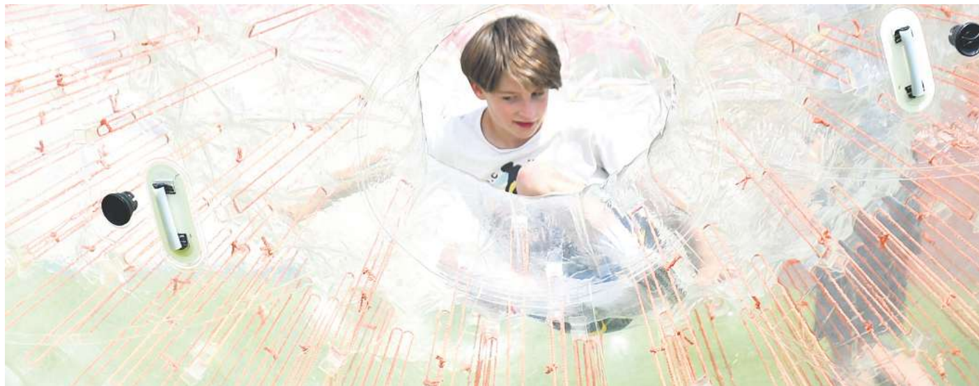
Ein junger Besucher findet die richtige Position, um im Zorb-Ball ins Rollen zu kommen.

... viel mehr reisen, die Welt entdecken und meine kreativen musikalischen Ideen mit Green Machine verwirklichen.