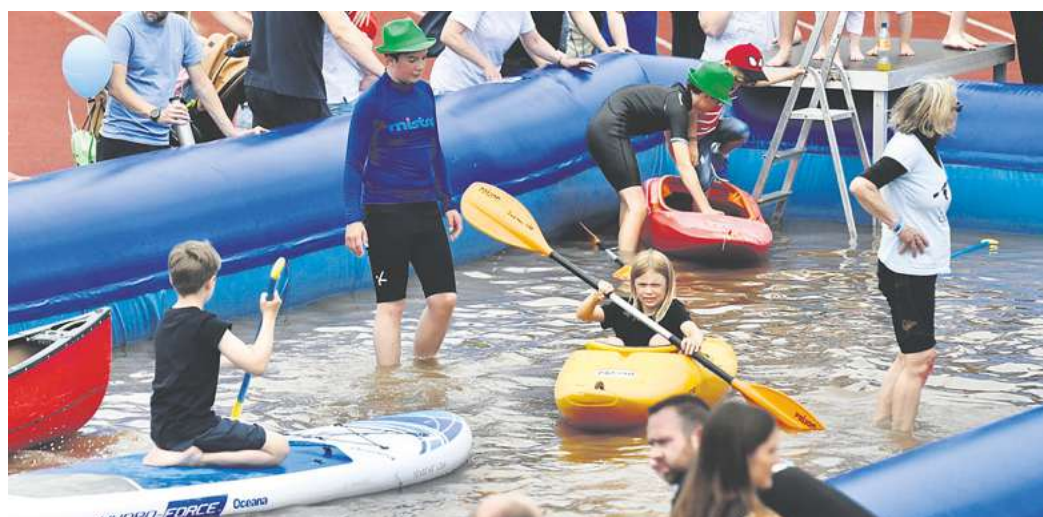
Paddeln auf der Laufbahn? Auch das macht „Schule, aber sicher!“ im Jahnstadion möglich.

Am 21. Juni soll aber auch der Spaß im Vordergrund stehen. „Uns ist wichtig, dass die Kinder Verkehrssicherheit nicht nur hören, sondern auch erleben“, sagt Hansmann. Durch prak-