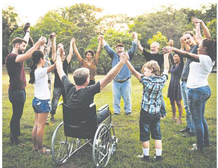
Gemeinnützige Körperschaften aus dem Geschäftsgebiet der EAM können sich ab sofort um die diesjährigen Fördermittel der EAM-Stiftung bewerben.