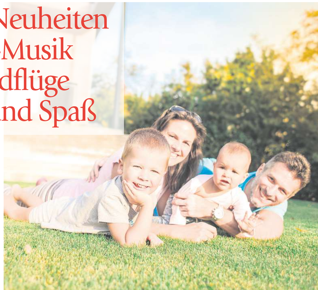
Die Frühlingsmesse bei Holzland Hasselbach präsentiert alles für Garten, Haus und Freizeit – mit vielen Messe-Schnäppchen.

Messe-Neuheiten Live-Musik Rundflüge Spiel und Spaß