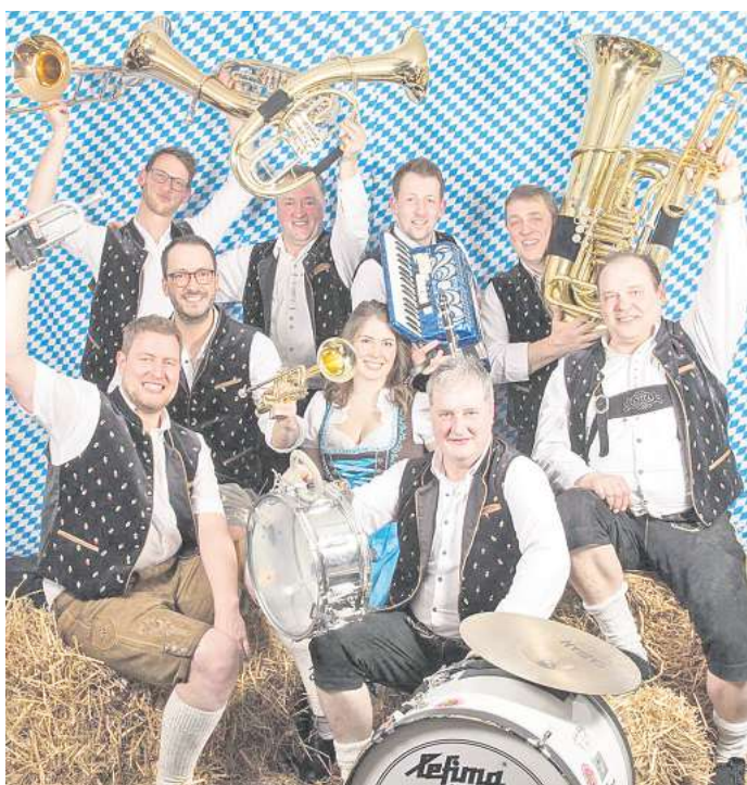
Die Eichenberger sorgen für Stimmung beim Frühlings-Sonntag.

ROSDORF. Der Frühling steht vor der Tür und damit kommt die große Lust, Haus und Garten für die Outdoor-Saison fit und schön zu machen. Das, was man dafür braucht, gibt es bei Holzland Hasselbach am Flüthedamm 2 in Rosdorf. Bei der Frühlings-Messe am 18. und 19. April präsentieren zusätzlich zahlreiche Aussteller ihre Produkte rund um Garten, Haus und Freizeit. Es werden dabei nicht nur die neuesten Trends vorgestellt, es locken auch viele Messe-Angebote und Schnäppchen in allen Abteilungen. Die Frühlingsmesse bei Holzland Hasselbach hat am Samstag, 18. April, von 9 bis 18 Uhr und am Sonntag, 19. April, von 11 bis 18 Uhr (Verkauf von 12 bis 17 Uhr) geöffnet. Für viele nicht bereits reduzierte Lagerwaren und die meisten Bestellartikel gilt an diesen Tagen: Die 19-prozentige Mehrwertsteuer wird den Kunden geschenkt. Nur wenige extra gekennzeichnete Artikel werden davon ausgenommen sein.