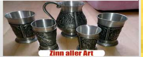
Zinn aller Art

*in Verbindung mit Gold Wir zahlen bis zu 8.500 € für Ihren Pelz*