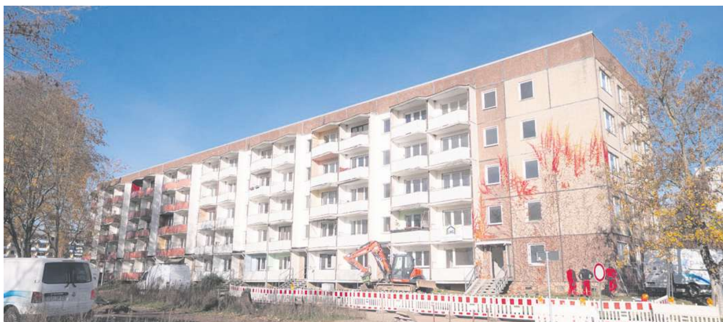
Der unsanierte Plattenbau in der Leinefelder Südstadt soll während der Landesgartenschau zum spektakulären „Blumenblock“ werden.

Der komplette Veranstaltungskalender ist auf www.lgs-leinefelde-worbis.de/veranstaltungen/ abrufbar und soll kontinuierlich erweitert werden. Tickets gibt es in der Gästeinformation im Rathaus Duderstadt sowie online und in Vorverkaufsstellen, die auf www.lgs-leinefelde-worbis.de/tickets/tickets-kaufen/ gelistet sind.