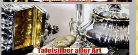
Tafelsilber aller Art

Kostenlose Begutachtung und Bewertung Ihres Schmuckstücks (auch bei Ihnen zu Hause)