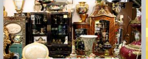
Antikes aller Art

Wir zahlen zur Zeit bis zu 140,- € *Euro pro Gramm Manufakturen