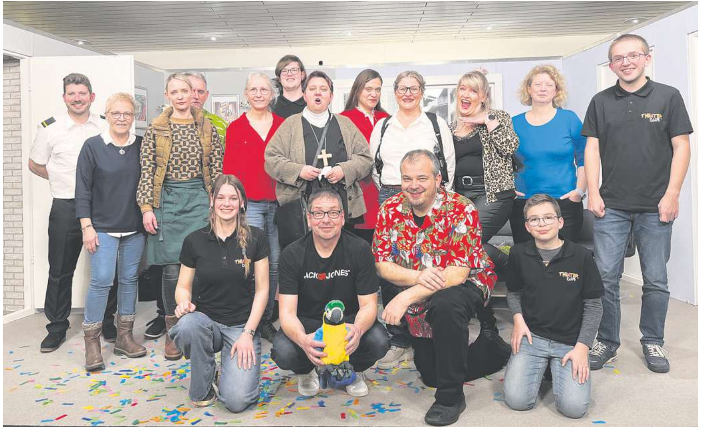
Die Laienspielgruppe Bilshausen: Ihre Mimik vor der Aufführung ist verräterisch – das wird lustig.

Teilnehmer „Informationen und Unterstützung rund um die Themen Inklusion und Förderung“. Während des Treffens sollen die Kinder heilpädagogisch betreut werden. So hätten Eltern Zeit, um Gespräche zu führen und Kontakte zu knüpfen. Interessierte Familien seien willkommen. Zur Vorbereitung ist eine Anmeldung im Familienzentrum Duderstadt erwünscht, so die Caritas: per E-Mail an familienzentrum@caritas-suedniedersachsen.de oder unter 0 55 27 / 98 13-902. CPS / SKI