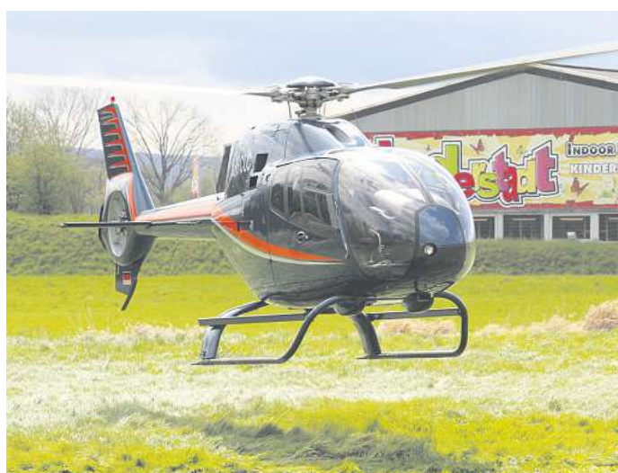
Auch Hubschrauber-Rundflüge werden wieder angeboten.

Während die Großen in dem vielseitigen Angebot stöbern und sich beraten lassen können, wird für die Kinder ein tolles Rahmenprogramm geboten: Für die kleinen Gäste gibt es kostenloses Kinderschminken und ein Karussell, dazu kommen viele Spiel- und Spaß-Aktionen sowie weitere Angebote, unter anderem Nistkästen bauen aus Holz. Spaß und Spiel gibt es für Klein und Groß: Bei der großen Tombola zugunsten des Jugendfeuerwehreviers Rosdorf kann man viele tolle Preise gewinnen und bei Hubschrauber-Rundflügen können sich die Besucher