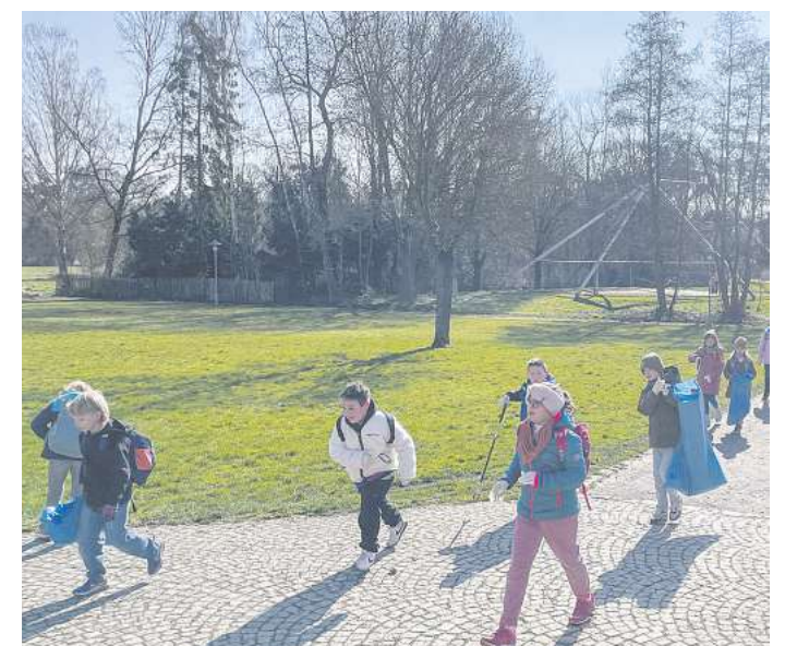
Kinder der zweiten und dritten Klasse der Maximilian-Kolbe-Grundschule sammeln im Duderstädter Stadtpark Müll.

Landesgartenschau. Er eröffnet uns die Chance, innovative Ideen zu gewinnen und zugleich starke Planungspartner für die kommenden Jahre zu finden“, sagte Feike. Die Veröffentlichung der Wettbewerbsauslobung ist für Mitte bis Ende April vorgesehen, so die Verwaltung. Anschließend hätten die teilnehmenden Planungsbüros mehrere Monate Zeit, um ihre Entwürfe zu erarbeiten. „Nach einem Bearbeitungszeitraum von etwa vier bis fünf Monaten soll das Preisgericht Mitte September den Sieger des Wettbewerbs bestimmen.“ PDUD / SKI