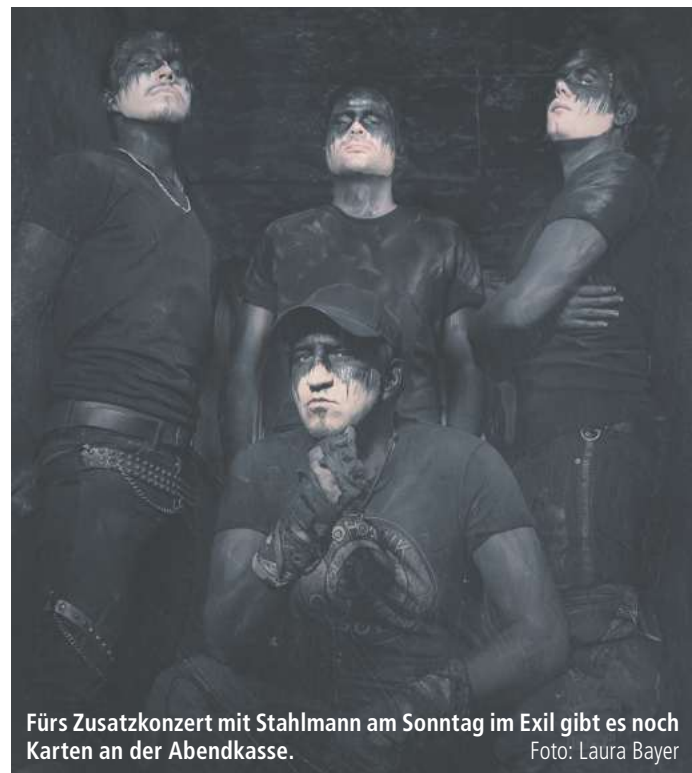
Fürs Zusatzkonzert mit Stahlmann am Sonntag im Exil gibt es noch Karten an der Abendkasse.

16.00 Burgmannshof Hardegsen: Frühling in Wien, Kammerkonzert mit Eilika Wünsch (Soprano), Sabine Grofmeier (Klarinette) und Bernhard Wünsch (Klavier und Moderation) 17.00 St. Cyriakus, Duderstadt: Gesang & Orgel