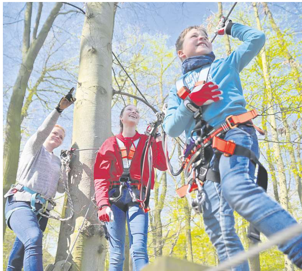
Kletterspaß auf dem großen Leuchtberg in Eschwege für die ganze Familie.

Ende März war Saisonstart auf dem großen Leuchtberg. Aus diesem Anlass lädt das Kletterwald-Team drei Leser zum Gratis-Spaß ein: Es werden drei Freikarten verlost. Wer gewinnen möchte, mailt mit Betreff „Kletterwald“ an gewinnen@extratip-goettingen.de und vergisst bitte nicht, seine Adresse anzugeben. Einsendeschluss ist am kommenden Dienstag, der Rechtsweg ist ausgeschlossen. Namen und Adressen der Gewinner werden zwecks Gewinnzusendung an das Team vom Kletterwald Eschwege weitergegeben.