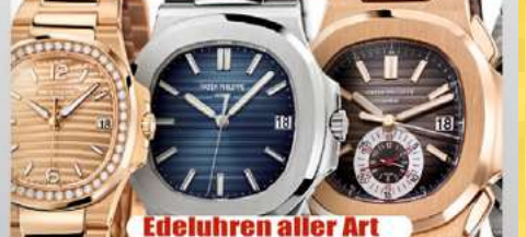
Edeluhren aller Art

Ihre Vorteile: ✓ kostenlose Beratung ✓ kostenlose Wertschätzung ✓ transparente Abwicklung ✓ Bargeld sofort