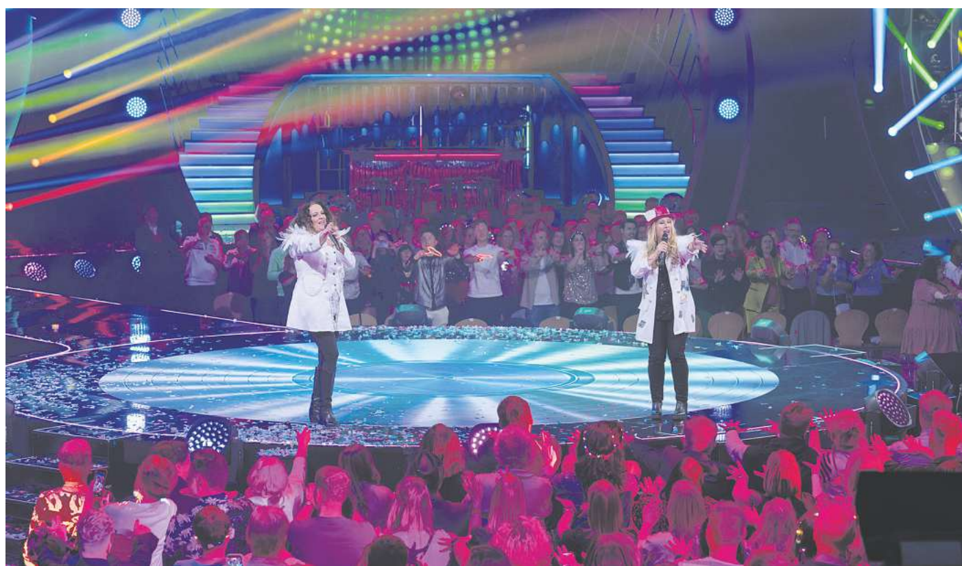
Die Großstadtengel sorgten mit ihrem Gute-Laune-Song für ordentlich Stimmung in der Lokhalle.

Die GIOVANNI ZARRELLA SHOW war zum zweiten Mal zu Gast in Göttingen