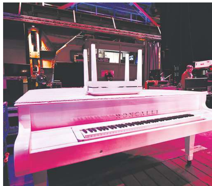
Das weiße Klavier vom Zirkus Roncalli wartete hinter den Kulissen geduldig auf seinen Einsatz.