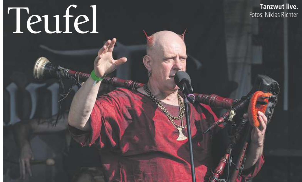
Tanzwut live.

Joachim Witt, der Headliner am Samstag, wurde in den 80ern mit „Goldener Reiter“ berühmt und ist seit vielen Jahren im düsteren Rock- und Pop-Genre erfolgreich – unter anderem mit „Die Flut“ zusammen mit Peter Heppner, der auch im Schloss-