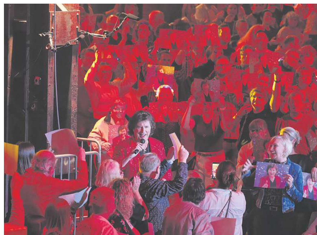
Olaf der Flipper beim Bad in der Menge in der Lokhalle.

mal Beschwerden gebe oder etwas nicht perfekt gelaufen sei. 150 bis 200 Köpfe arbeiten bei der Giovanni Zarrella Show