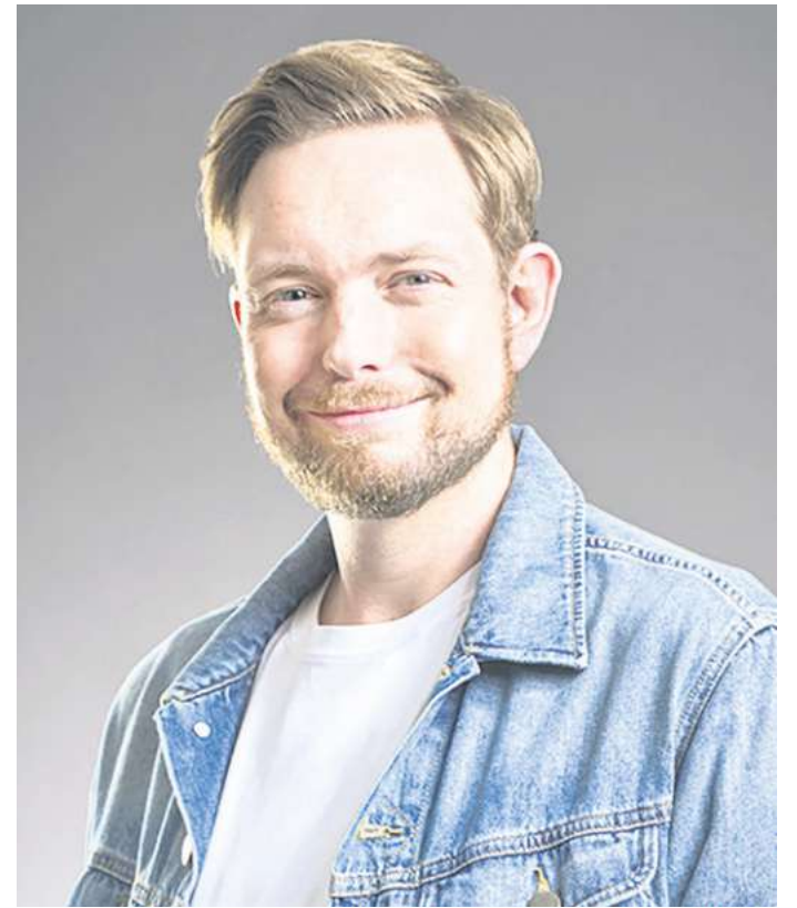
Bastian Bielendorfer ist am 8. Mai in der Göttinger Stadthalle.