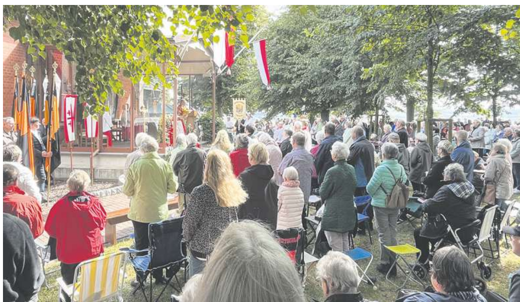
Große Wallfahrt auf dem Höherberg 2025.