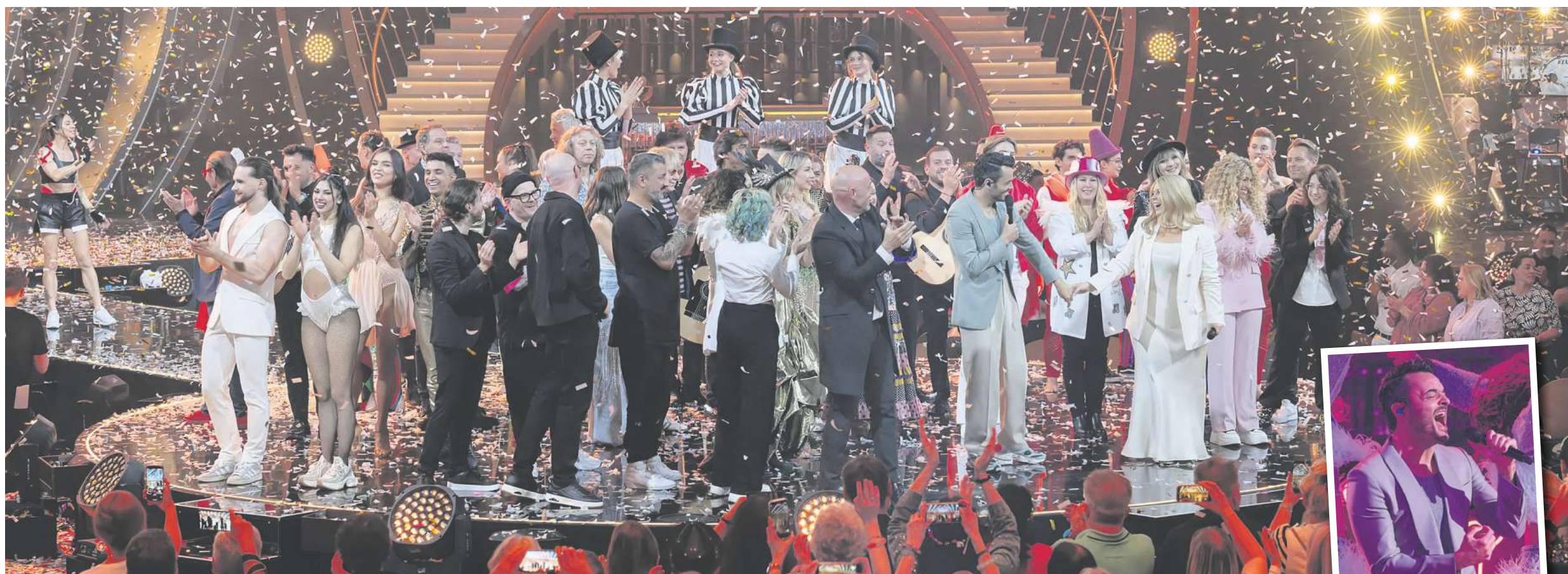
Die Giovanni Zarrella Show „Party pur“ live aus der Göttinger Lokhalle sahen rund drei Millionen Menschen im ZDF.